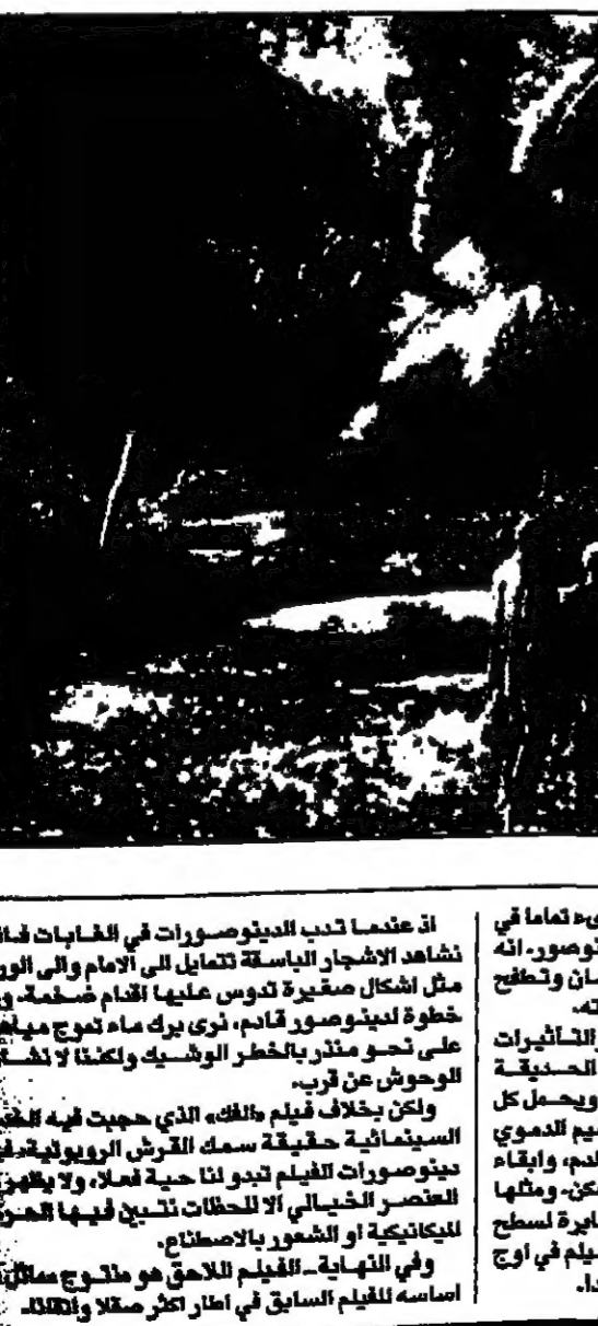
مزة لشرى وجها لوجه مع الديتوسور في فيلم العالم الضائع الحديقة الجوراسية